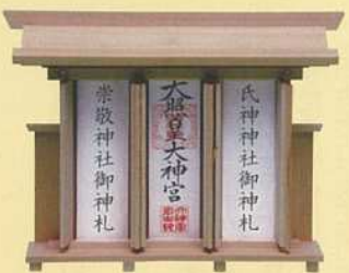
中央に神宮大麻、向かって右に氏神さま、左に崇敬する神社のお神札