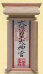
手前に神宮大麻、つぎに氏神さま、一番奥に崇敬する神社のお神札